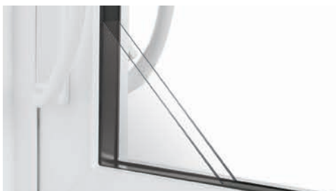
Unité scellée de 7/8''