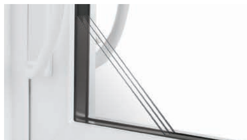
Unité scellée de 11/4''